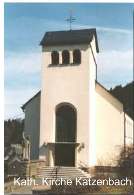
Kath. Kirche Katzenbach