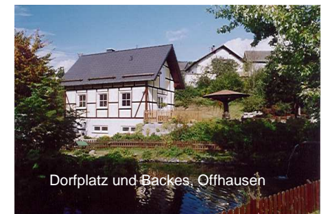
Dorfplatz und Backes, Offhausen