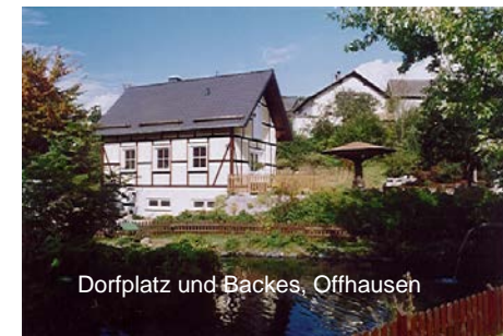
Dorfplatz und Backes, Offhausen