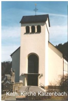
Kath. Kirche Katzenbach