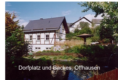
Dorfplatz und Backes, Offhausen