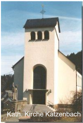
Kath. Kirche Katzenbach