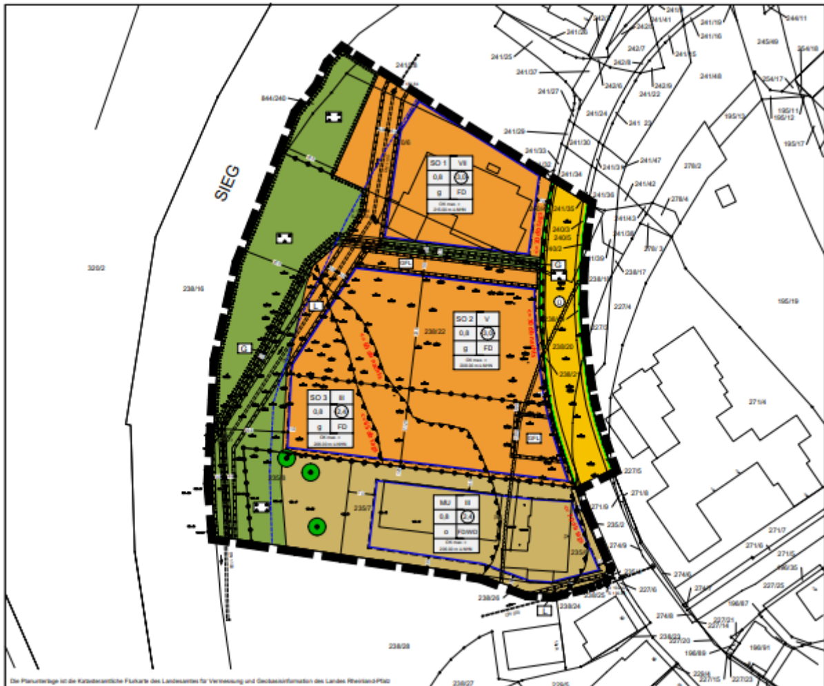
Entwurf Bebauungsplan „Nr. 1. Änderung Kreiskrankenhaus und Umgebung“ in der Fassung von Juni 2022.

In der nachfolgenden Übersicht ist die genaue Lage zur 1. Änderung des Bebauungsplanes „Kreiskrankenhaus und Umgebung“ durch eine gestrichelte Linie gekennzeichnet.